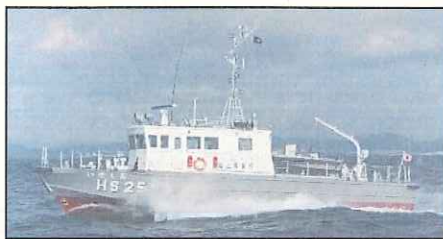
【使用する作業船】測量船「いせしお」(30t)

誤って流速計に接触した場合、又は漂流(漂着)しているのを、発見した場合には第四管区海上保安本部洋情報部に連絡をして頂きますようお願いいたします。