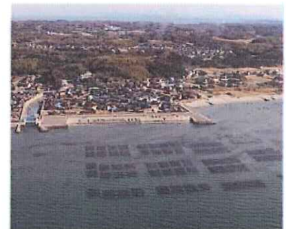
【のり網の設置状況】